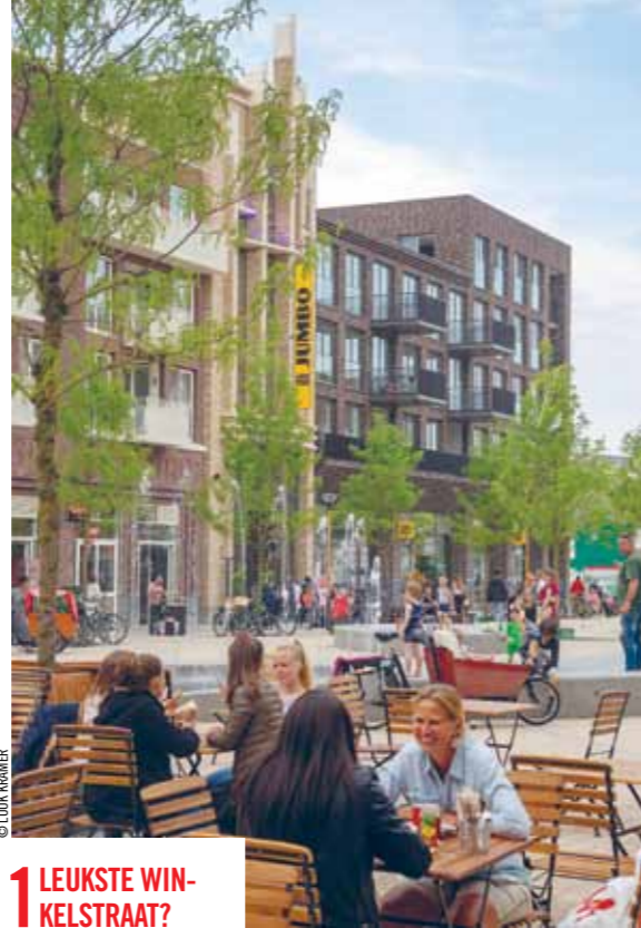
© LUUK KRAMER © MISSON WOUTER