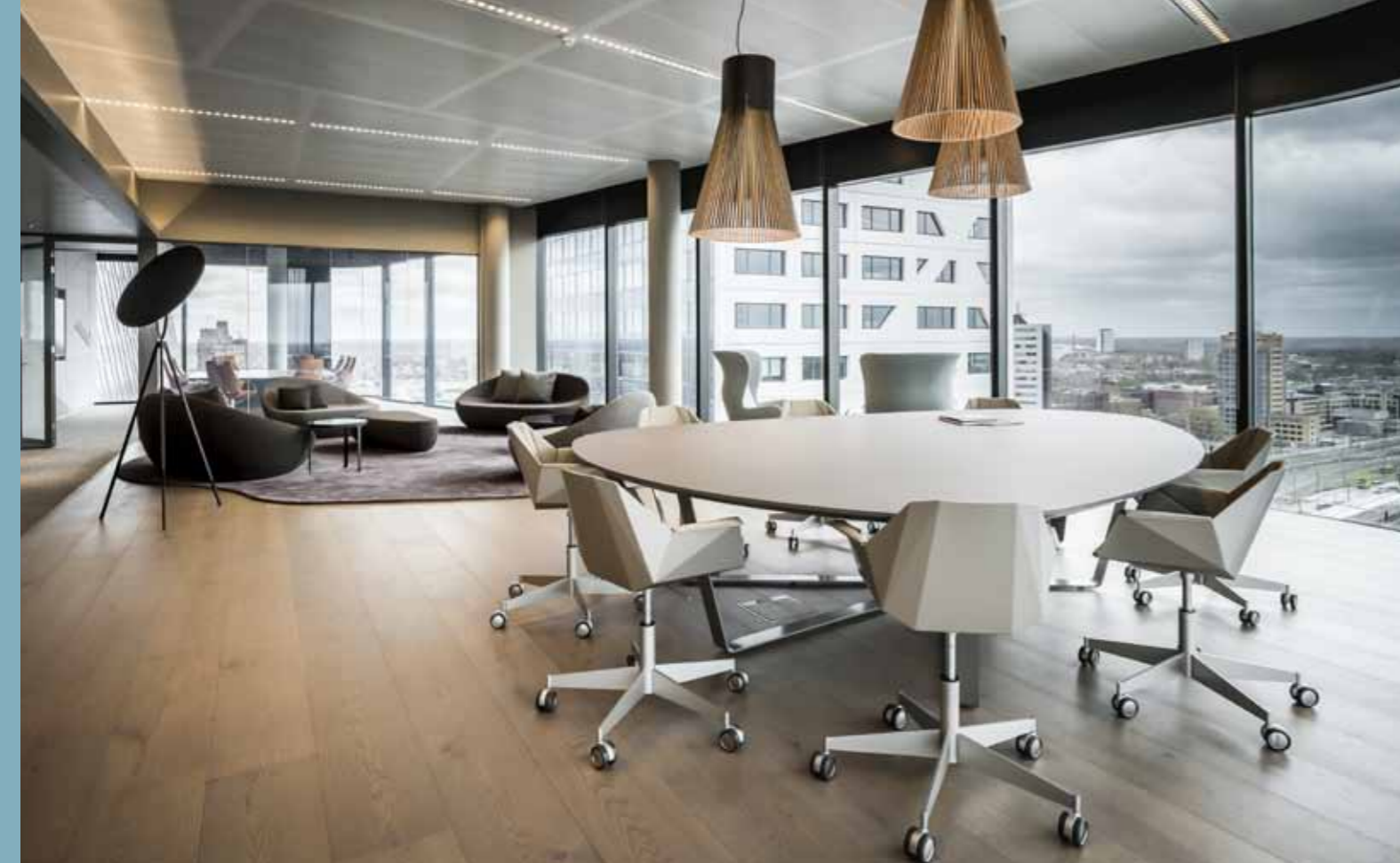
Aalberts WTC Utrecht werk- en ontmoetingsruimten

bij elkaar vormen een totaalontwerp wat functioneert, inspireert en communiceert. Afgewogen, sprankelend, eigen en met een herkenbare kwaliteit.'