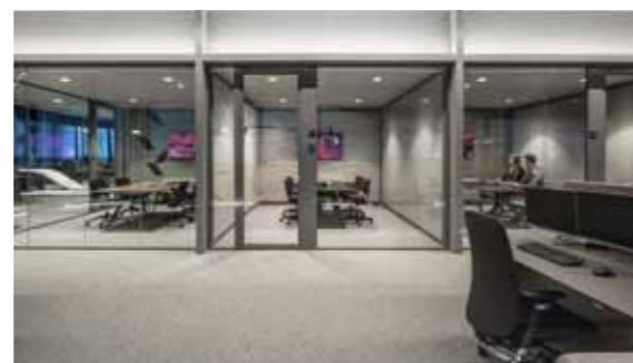
Aalberts WTC Utrecht open zones en flexruimten

Nauta Dutilh was nieuwbouw, een lege huls. Daar moesten we de totaalsfeer vanaf nul opbouwen. Het heeft nu een geheel eigen samenhangend karakter, een mix van menselijkheid, warmte en kunstzinnigheid.'