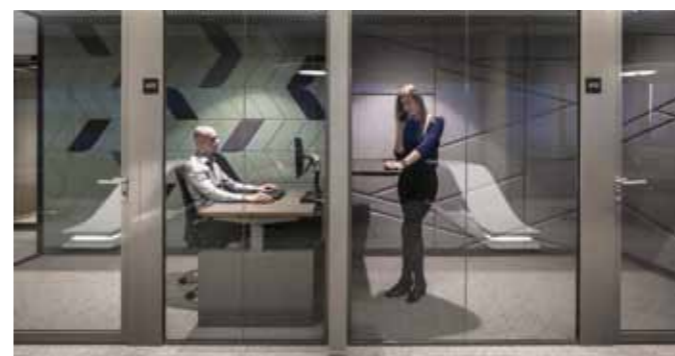
Flexruimten tegen de kern

functioneren, en die hubs zijn dan de ontmoetingsplekken voor de medewerkers. Die torens langs de ring kunnen dan mooi tot woningen worden omgebouwd, met meer groen! Voor ons als interieurarchitecten ontstaan dan nieuwe uitdagingen om in historische of eigentijdse gebouwen die identiteit van onze opdrachtgevers neer te zetten. Minder vierkante meters maar veel meer karakter met mooie totaalontwerpen!'