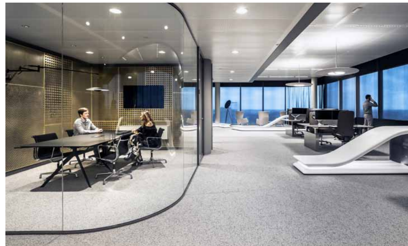
Aalberts WTC Utrecht werk- en ontmoetingsruimten