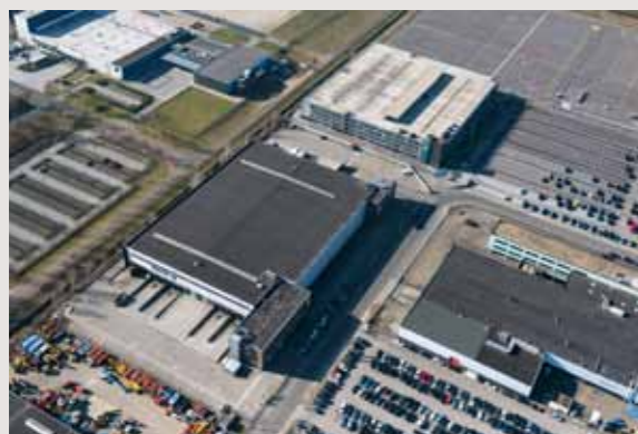
Jan Hilgersweg, Eindhoven

Van Boxtel beaamt dat. 'Internationale bedrijven kijken, eveneens op basis van data, steeds vaker ook buiten hun landsgrenzen. Wij kunnen hun probleem lokaal oplossen of een innovatieve vastgoedoplossing elders bedenken.'