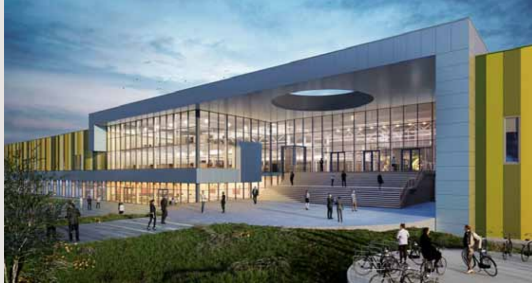
Brainport Industries Campus