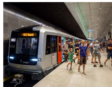
Metrolijn 52, ook wel bekend als de Noord/Zuidlijn