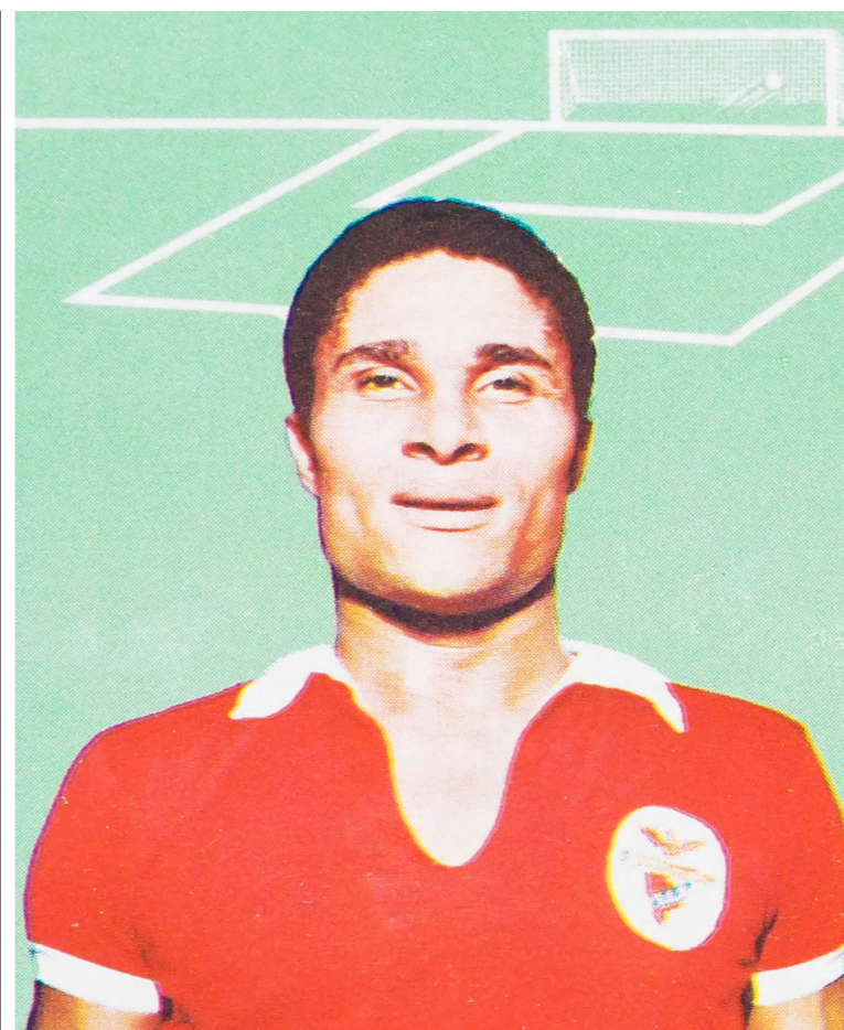
Eusébio da Silva Ferreira