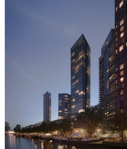
Circulair Metropolitan Student Tower – Rotterdam

Deelnemen aan prijsvragen doet het bureau ook, maar dat is tijdrovend en kostbaar en het resultaat is op zijn zachtst gezegd onzeker. Daarom heeft Reintjes besloten tot een meer proactieve aanpak. ‘We werken nu samen met Zero People, die zich stadsontwikkelaars noemen. Zij hebben niemand in dienst, maar schakelen specialisten in op het moment dat het nodig is. Met een kleine overhead en een groot netwerk weten zij precies wat er speelt. Zij kennen de grote beleggers en weten waar de kansen liggen.’ Het honorarium volgt als de opdrachten definitief worden,