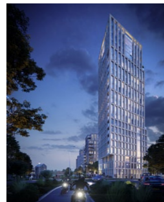
Herkenningspunt aan de Waal - Nijmegen Havenkade