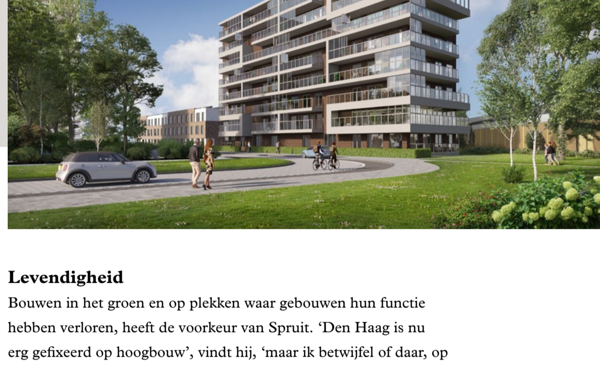
De Bovenmeester Schiedam

‘HET UITERLIJK DOET ER ZEKER TOE, MAAR BOUWKUNDIGE KWALITEIT IS PAS ÉCHT BELANGRIJK’