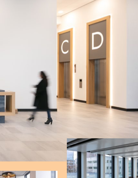
Blaak 16 Rotterdam