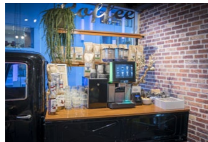
De stijlvolle entrance van Element Offices met voorzieningen om lekker te kunnen werken of voor een informeel overleg