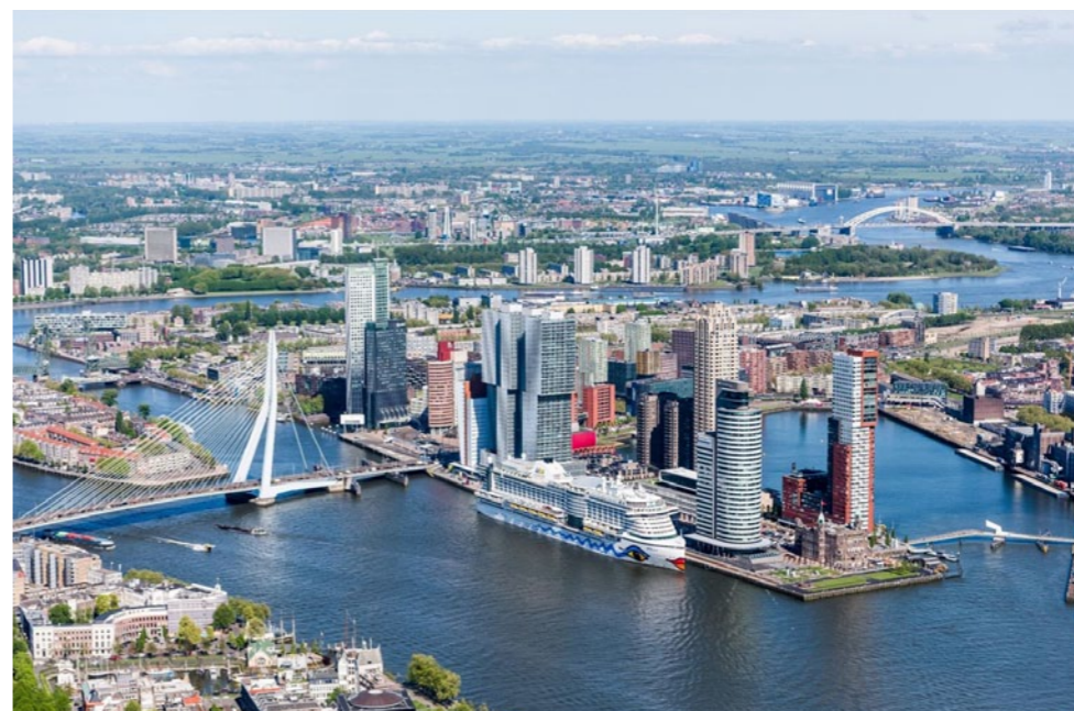
Kop van Zuid

Fokker vervolgt: ‘Op de flexofficemarkt zie ik in dit kader veel potentie. Als je als huurder in plaats van een vast huurcontract van een paar jaar, op flexibele basis kantoorruimte van maand tot maand