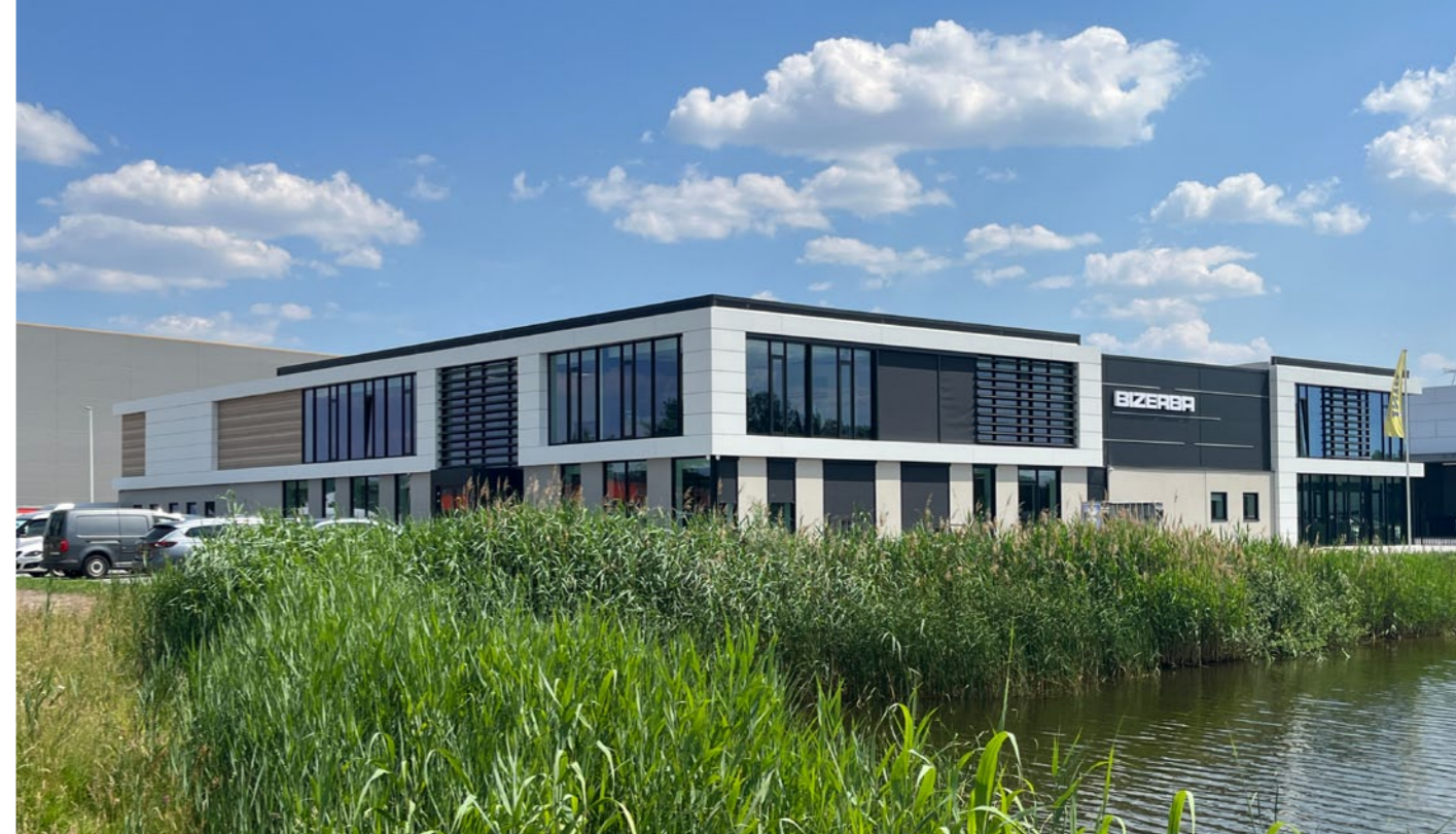
Hengelo - Veldkamp Bizerba/ INTR

‘In Twente vormen duurzame en groene bedrijventerreinen inmiddels een belangrijke schakel tussen stad en land’, gaat Marieke verder. ‘Het zijn gebieden geworden waar je niet alleen maar werknemers treft op weg naar werk of huis, maar ook fietsers en wandelaars, die niet langer met een grote boog het gebied mijden. Deze schakels tussen stad en land, met steeds meer soorten vogels en insecten, zijn mede te danken aan diverse initiatieven van Twentse pioniers, die inspirerende bedrijfsgebouwen en omgevingen hebben ontwikkeld. Ik ben oprecht trots op wat deze collega-ondernemers hebben gerealiseerd in onze regio, waarmee ze Twente en