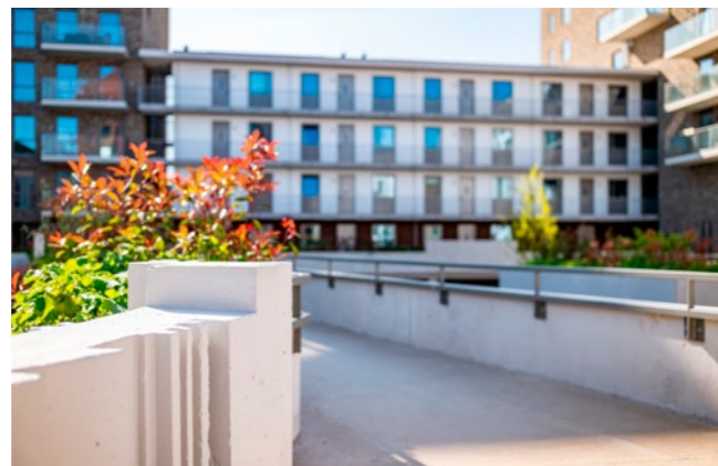
Op deze foto is de connectie tussen de verschillende gebouwen zichtbaar.