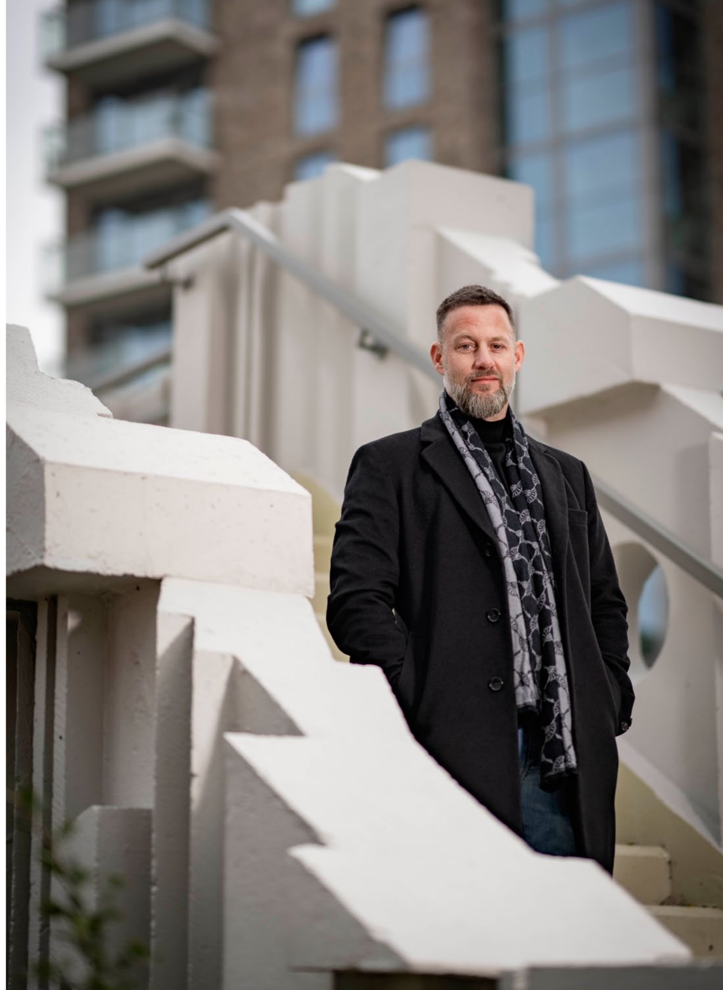
Crossroads: Nieuw wonen op een historische plek, energiezuinige kadewoningen & appartementen in een levendige stadswijk in Groningen.

‘Een ingewikkelde periode met toch ook mooie kanten’, blikt Gils terug. ‘Als ondernemer weet je dat je risico loopt, maar de extreem snel stijgende prijzen van bouwmaterialen en rente had niemand voorzien. Met alle betrokken partijen zijn we open het gesprek aangegaan. Ik merkte dat je een crisis niet alleen hoeft te dragen. Gezamenlijk zochten we naar oplossingen. Waar in hoogconjunctuur de onderhandelingen keihard zijn, voelde je nu in de hele keten de waarde van ‘gedeelde smart’.