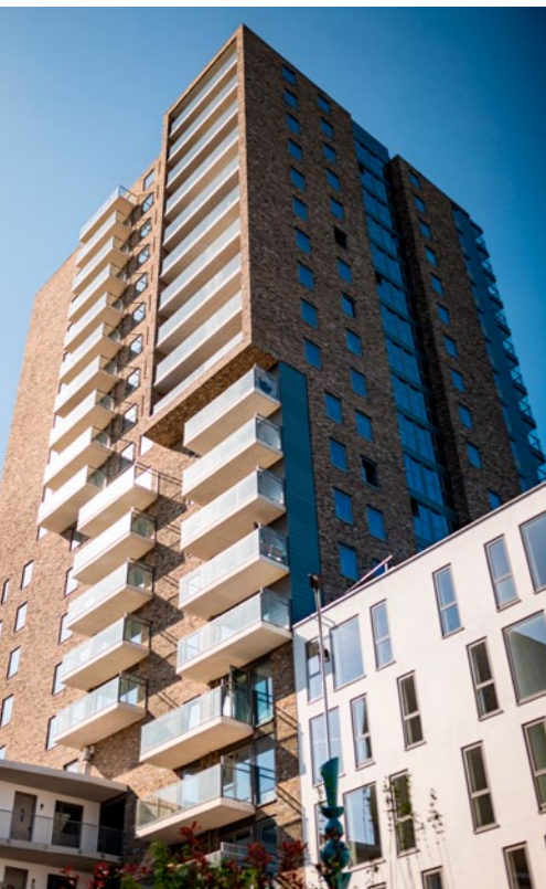
Crossroads: Nieuw wonen op een historische plek, energiezuinige kadewoningen & appartementen in een levendige stadswijk in Groningen.