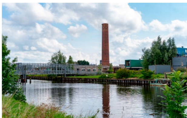
Suikerzijde Groningen