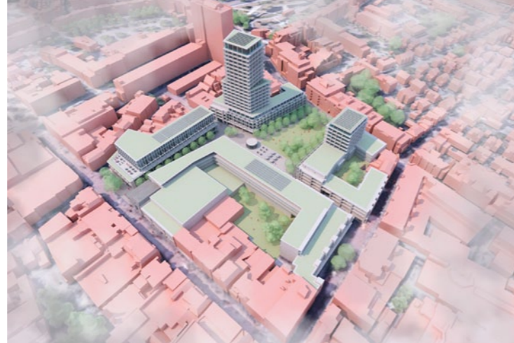
Oranjerie, Apeldoorn Bridges | ZZDP