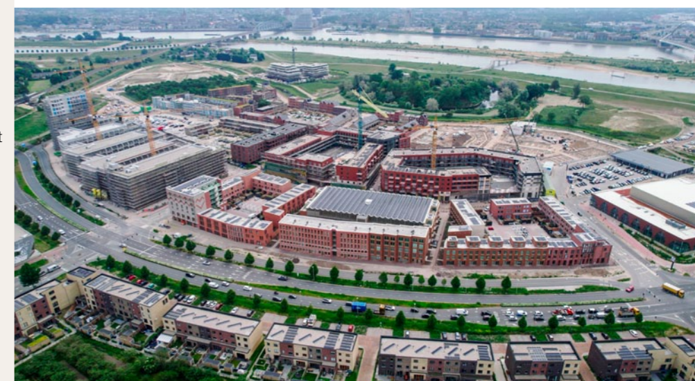
Hart van de Waalsprong, Nijmegen AM | VanWonen