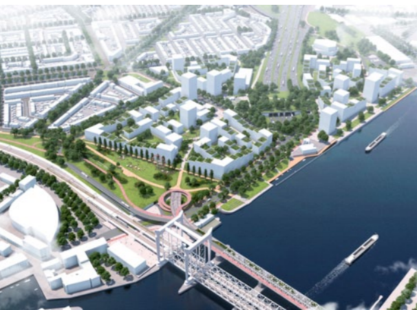
Maasterras, Gemeente Dordrecht, Stadsas Dordt, Mecanoo