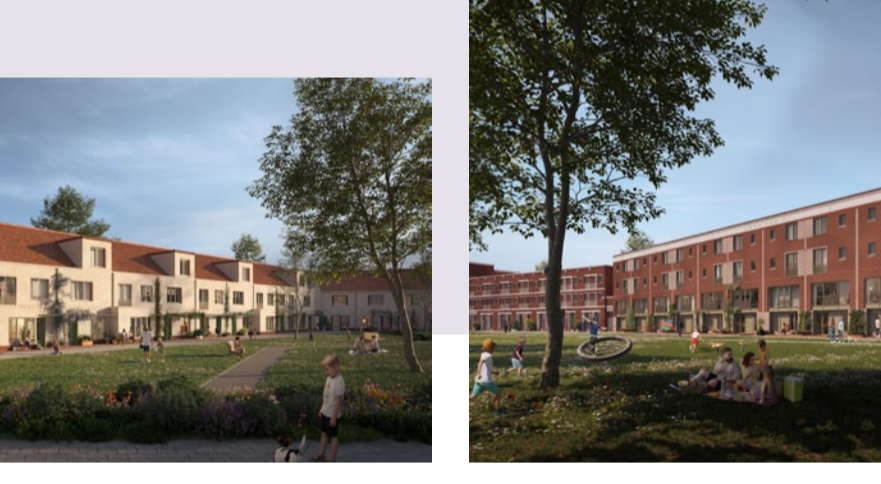
U bent halvevege

‘TUINONDERHOUD KUNNEN WE VOOR 100 PROCENT INKOPEN, MAAR DAARMEE MAAK JE GEEN HECHTE BUURT. TROTS KOMT VAN BINNENUIT’