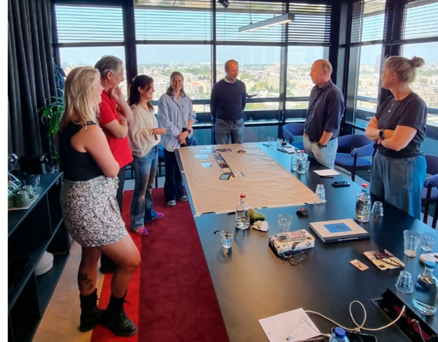
Team u.minds Climate Fresk