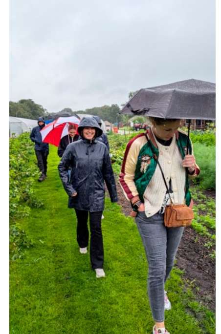
Team u.minds werkbezoek Sociaal en Vitaal, Nieuwehorne